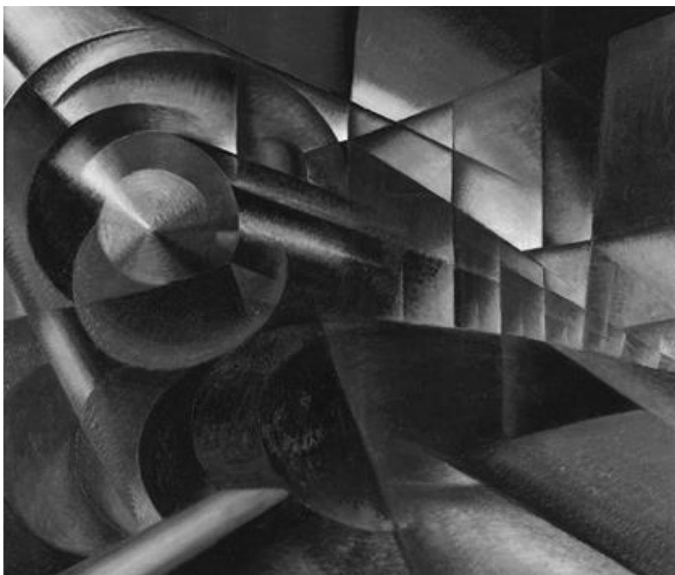
Иво Паннаджи. Ускоряющийся поезд, 1922 г.