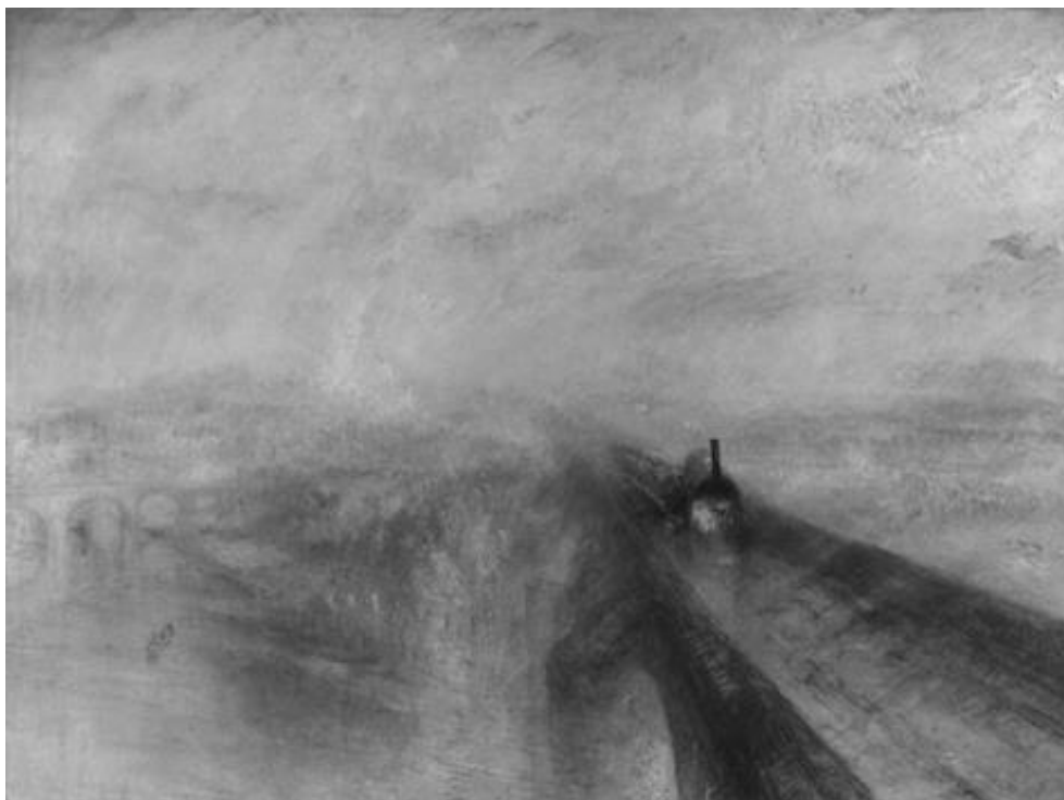
Уильям Тёрнер. Дождь, пар и скорость, 1844 г.